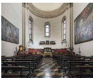
Cappella di S. Luca