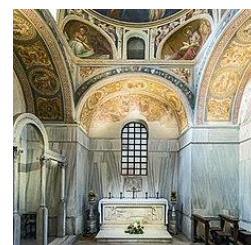
Sacello di San Prosdocimo