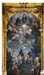
Martirio di S. Giustina